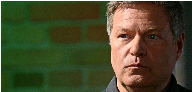
Robert Habeck (Bündnis 90/Die Grünen), ehemaliger Bundesminister für Wirtschaft und Klimaschutz

Stand: 12.05.2026 | Lesedauer: 3 Minuten