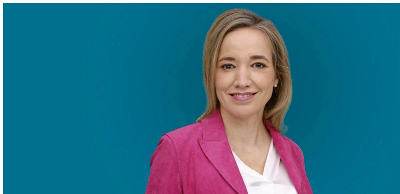
WELT-Kolumnistin Kristina Schröder